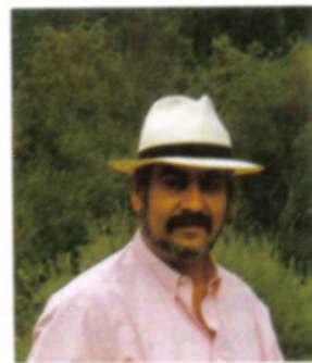
POR ALBERTO LOZANO

Hace ya bastante tiempo, Apple inició su programa de desarrolladores. En aquellos tiempos, para ser desarrollador de Apple, bastaba con demostrar que se estaba trabajando en la creación de un programa interesante, en esas circunstancias, Apple hacía firmar un contrato al futuro desarrollador para que se convirtiese en "Desa-