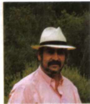
POR ALBERTO LOZANO

Resulta que una de las maneras de aumentar la velocidad de un ordenador, además