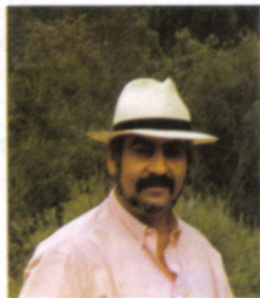
POR ALBERTO LOZANO